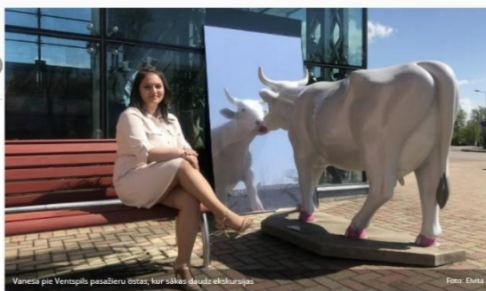
Vanesa pie Ventspils pasāžieru bostas, kur sākas tūrisma ekskursijas

SVARĪGI » Olimpiskās spēles - Tokija 2020 Migrantu krīze pie Baltkrievijas robežas Skolēnu dziesmu un deju svētki Kultūrdobe Koron