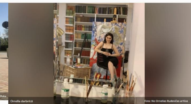
Ornella darbnīcā

SVARĪGI » Olimpiskās spēles - Tokija 2020 Migrantu krīze pie Baltkrievijas robežas Skolēnu dziesmu un deju svētki Kultūrdobe Koron