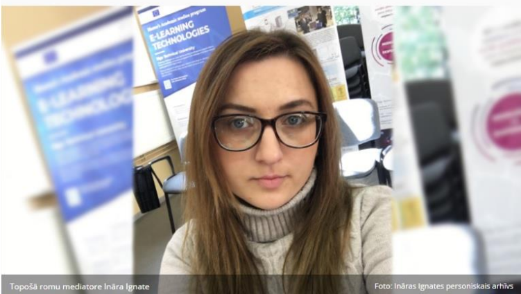
Topošā romu mediatore Ināra Ignate