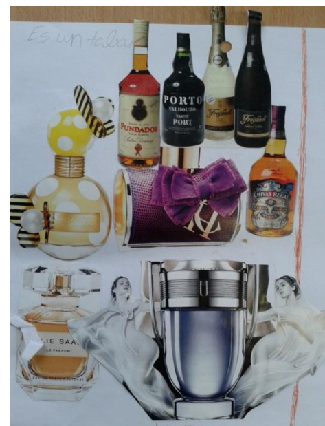
Foto: pusaudžu veidotās kolāžas par alkoholu