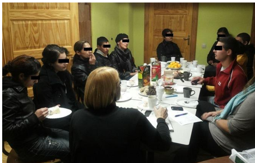
Foto: fokusgrupas ar vecākiem norise

Tālākajā fokusgrupas diskusijas gaitā romu pusaudžu vecākiem tika lasīts tas pats stāsts, kas aprakstīts 3.3.nodaļā. Jāatzīst, ka vecāki pauda par stāstu līdzīgus viedokļus kā pusaudži. Proti, vecāki atzīst, ka narkotikas stāsta varone visticamāk uzsākusi 14-16 gadu vecumā. Tāpat tiek atkārtoti atzīts, ka sievietē atkarības vielu lietotāja romu populācijā ir daudz nepieņemamāks fenomens kā vīrietis vielu lietotājs.