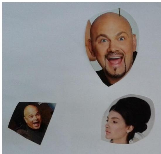
Foto: pusaudžu veidotās kolāžas par narkotikām