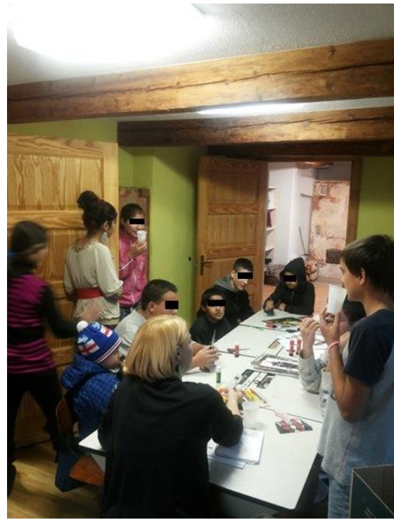
Foto: fokusgrupas ar pusaudžiem norise