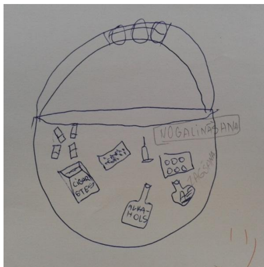
Foto: pusaudža zīmējums asociāciju uzdevumam

Fokusgrupas sākumā pusaudžiem tika dots asociāciju uzdevums. Proti, tika lūgts, lai jaunieši iztēlojas, ka iet pa ielu tumsā, vēlā vakarā, un dzird aiz sevis skrējēja soļus. Persona paskrien garām un netālu nomet somu. Somā ir atkarības vielas. Pusaudžiem tika lūgts uzzīmēt, kas ir somā, un pēc tam parādīt zīmējumu pārējiem klātesošajiem un pastāstīt par to.