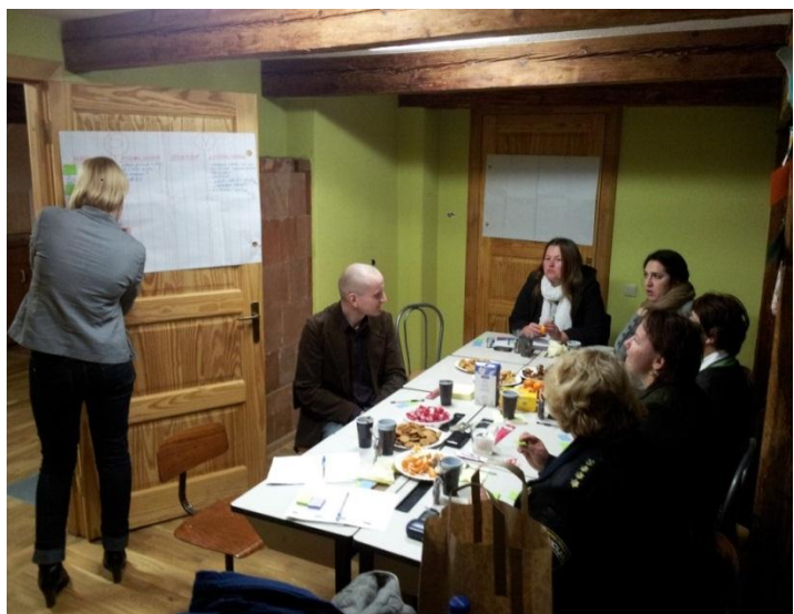
Foto: fokusgrupas ar ekspertiem norise